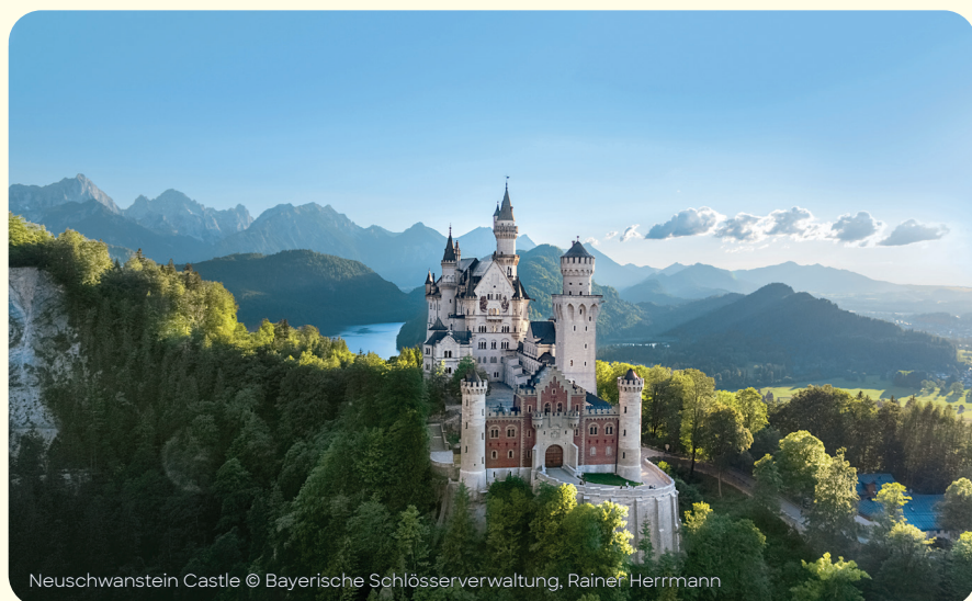
Neuschwanstein Castle

Maaltijden: ontbijtbuffet, 's avonds 3 gangenmenu